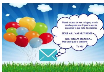
Figura 8. Prototipo final-Segunda pantalla

Ahora tratando de abordar cómo se podría hacer la relación del adulto mayor con su familiar más cercano, ya que en dichas entrevistas ellos comentaban que lo más importante eran sus familiares y la relación o el tiempo que podían estar en contacto con ellos. Y fue ahí donde elaboró el diseño mostrado en la Figura 8.