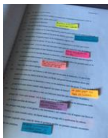
Figura 2. Entrevista transcrita con postis

Posteriormente, al tener las ocho entrevistas, se transcribieron todas las entrevistas para así poder analizar los datos obtenidos de cada participante. El siguiente paso fue a cada entrevista escrita colocar postis a cada comentario que pensábamos que nos serviría o que considerábamos importante.