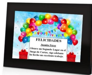
Figura 6. Porta retrato con el logro que obtuvo el adulto mayor.

La siguiente fase fue reducir los diseños de diez a tres. Para esto se siguió utilizando el diseño con papel y lápiz, sólo que los diseños fueron de una forma más detallada. Y se utilizaron varias técnicas como: Sketching , storyboarding .