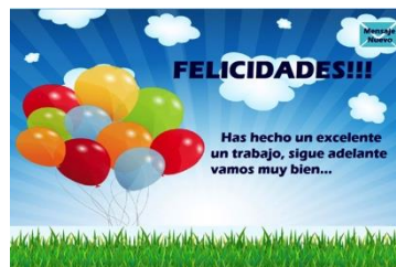
Figura 7. Prototipo final - Pantalla principal

Esto ayudó a diseñar el siguiente prototipo que pueda ser usado en cualquier tecnología como: aplicaciones de entretenimiento, recordatorios de medicamentos, entre otras. Básicamente consistiría en que al final se les premiará con un mensaje dependiendo de la puntuación obtenida, pero siempre animándolos para que siga adelante.