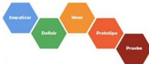
Figura 1. Fases de la metodología DesignThinking

investigación fue cualitativa, pues los datos recolectados fueron por medio de unas entrevistas semi-estructuradas que constaban de 25 preguntas sobre gustos, actividades, sentimientos del adulto mayor.