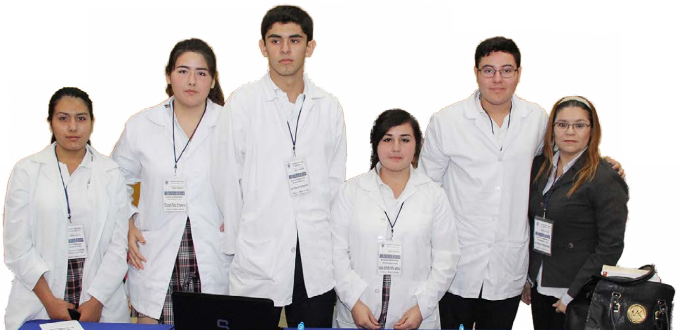
Equipo ganador el Instituto Regional de Guaymas, Unidad Obregón