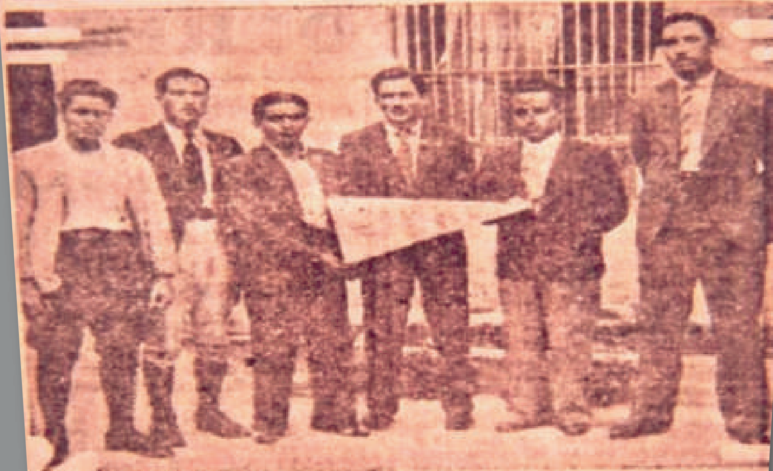
Estos son los jóvenes estudiantes de medicina que componen la brigada enviada a Mérida, por la Universidad Nacional de México, y cuya labor ha sido muy elogiada.

Millares de habitantes de las distintas regiones en que se encuentran las misiones de estudiantes de medicina, han sido curados por estos futuros galenos, habiendo logrado la mejoría de muchos de ellos gracias, referentemente, a que llevaban elementos suficientes para atender casos de urgencia.